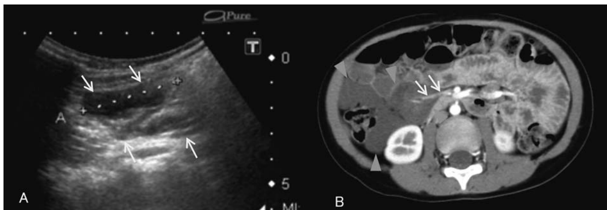
図 2 症例 2 の画像所見

同科で再度施行された腹部 MRI により腸間膜リンパ管腫と画像診断された。しかし、転院時には腰部のだるさが消失していたことに加えて腫瘍内部を右結腸動脈が走行していたため、腫瘍の完全切除には右半結腸 (回盲部～横行結腸口側半分) 切除術が必要となることから早急な外科的処置は適さないと判断され、10 病日に退院となった。退院後は京都府立医科大学小児科・小児外科外来でフォロー中であるが、1 年 10 か月後の現在、順調に経過している。