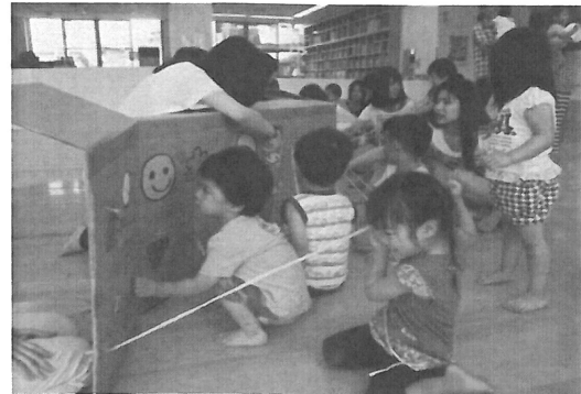
とびでるりぼん ーわあ! できたあー!!

毎回のことであるが、安全確保のための様々な係りの協力があって無事終えられている事を感謝している。今回も季節柄、駐車場係りは炎天下での対応となった。（係の先生・学生さん本当にご苦労様でした。感謝いたします）