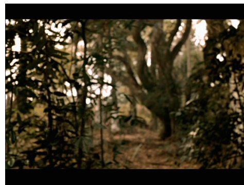
Figura 6: Diálogo com o impressionismo pictórico, em Lavoura arcaica (CARVALHO, 2001).