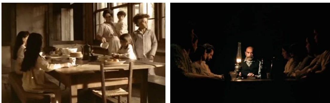
Figura 03: Duelo de luzes - Luz da infância X Luz Tenebrista, em Lavoura arcaica (CARVALHO, 2001)

Essa luz se contrapõe à luz tenebrista do pai autoritário, emocionalmente distante, portador da verdade absoluta, que fala os sermões na fazenda iluminada apenas por uma luz de lampião. Se por um lado a mãe alimenta as crianças na cozinha iluminada, por outro, o pai, também à mesa, é uma presença autoritária que tenta doutrinar, com palavras severas, os filhos silenciosos.