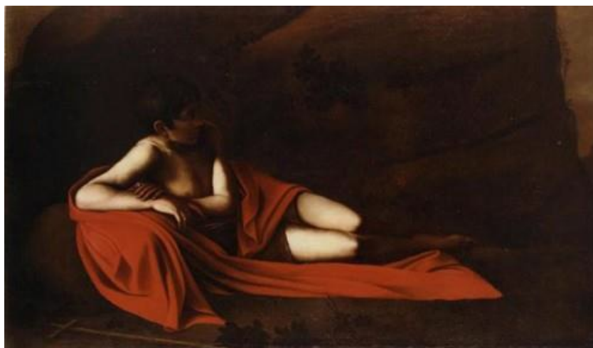
Figura 4: São João Batista reclinado, 1610, Caravaggio

de André falam do amor incestuoso entre os dois como um milagre. A antítese prossegue nos papéis que ele atribui aos pais na sua fala: “Se o pai no seu jeito austero quis fazer da casa um templo, a mãe transbordando no seu afeto só conseguiu fazer dela uma casa de perdição.” Religiosidade e erotismo se juntam, portanto, como no quadro do São João Batista do Caravaggio.