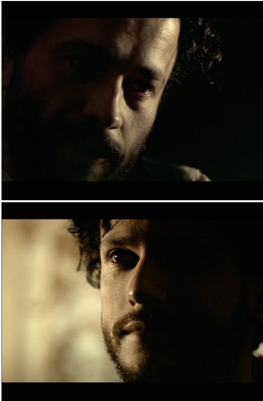
Figura 5: Conversa entre irmãos: a Luz Tenebrista , em Lavoura arcaica (CARVALHO, 2001)

A fotografia dessa cena apresenta enquadramentos, predominantemente, em primeiro plano, e uma luz lateral (a luz tenebrista) responsável pelo forte contraste de luz e sombra. Essa oposição alcançada pela iluminação sugere o estado interior dos personagens. A fotografia está voltada mais para dentro do que para fora. Ela não pretende expressar a história de uma família tal como se vê na realidade cotidiana e sim mesclar-se ao estado de angústia e de sofrimento a que seus membros se encontram aprisionados. Sabe-se que será com o retorno de André que a dimensão mortífera de uma Lei transgredida comparecerá.