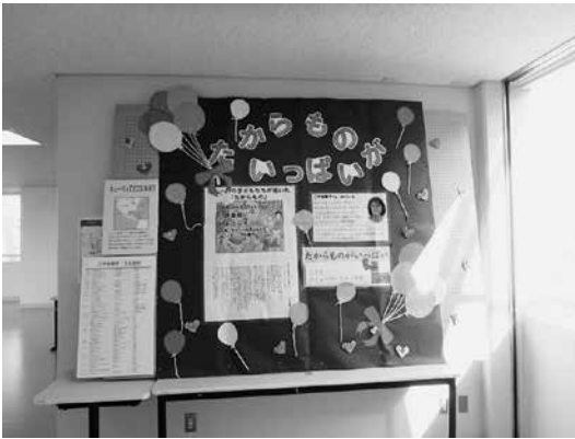
フォーラム会場入り口

設していた。子どもを同伴した親も来場し、子どもを見守りながら、こやま氏のおはなしに耳を傾ける様子が見られた。