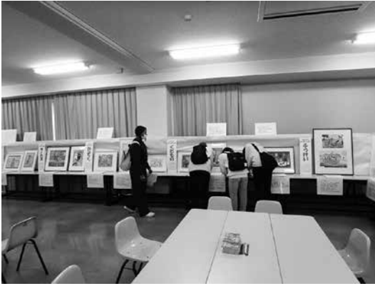
絵本原画展の様子