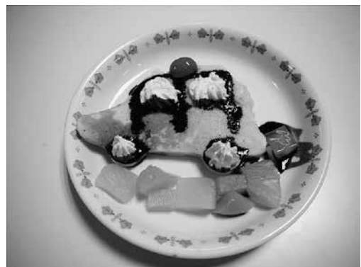
作成したホットケーキ