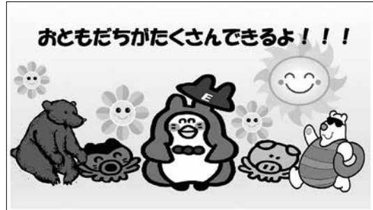
パワーポイントの絵