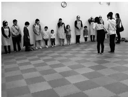
だるまさんがころんだ