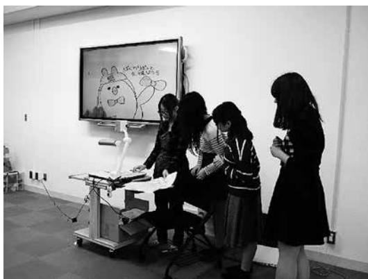
リハーサルの様子

第3回：1回目の発表練習を行った。各グル ープがパワーポイントのライドショーによって、 物語を画面に映し出し、画面の前でストーリーや セリフを読み、演じた。それぞれのグループに対