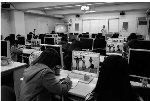
動画での振り返り