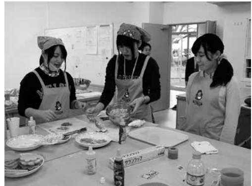
ホットケーキ作り