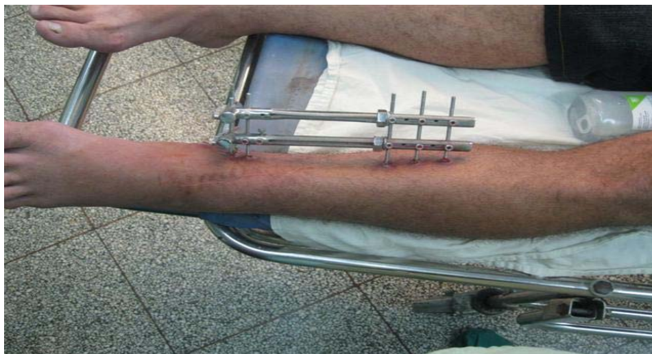
Figura 2. Fractura abierta de tibia grado II tratada con fijación monopolar doble de urgencia. Evolución a los tres meses

La importancia del costo es, cada vez, un asunto de importancia en un mundo en crisis; en Cuba, un país subdesarrollado e inmerso en múltiples cambios en el sector de la salud, el ahorro de recursos y de bienes constituye uno de los pilares de los lineamientos económicos actuales, por lo que una menor estadía y un mínimo de recursos y medicamentos utilizados en la mayoría de los casos son las pautas del tratamiento para la colocación de este método de fijación de urgencia. 18