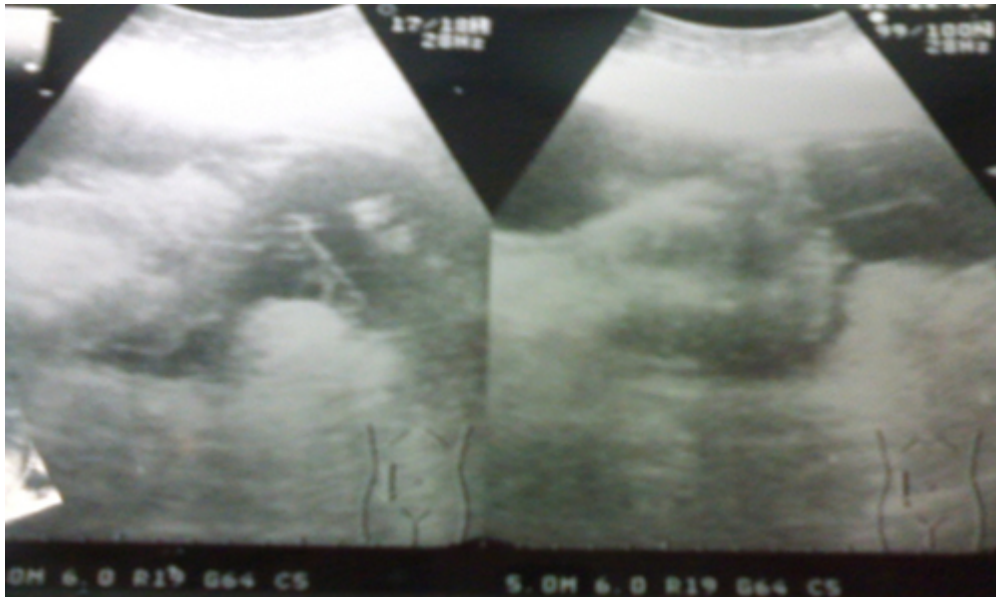
Figura 3. Imagen ecográfica de abdomen en la que se observa líquido libre en cavidad, grueso bolsón multilobulado subfrénico derecho y aumento de la ecogenicidad hepática