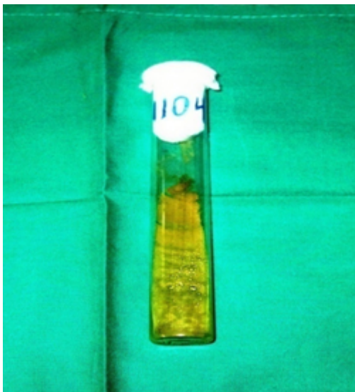
Figura 1. Muestra de líquido peritoneal con crecimiento de Aspergillus spp. en medio de Sabouraud

Una vez concluidos los ciclos de antimicrobianos y después de constatar negatividad en los cultivos efectuados la paciente continuaba con fiebre de 38 a 39°C, pero mantenía buen estado general y ausencia de otras manifestaciones sintomáticas, lo que motivó al grupo de trabajo a buscar otras causas infecciosas que justificaran el cuadro febril, entre ellas: estudio de citomegalovirus -a través de la reacción en cadena de la polimerasa cualitativa (PCR) en suero y el cultivo del líquido peritoneal en medios-, bacteriano, micológico y bacilo ácido alcohol resistente (BAAR). No se demostró la positividad para anticuerpos IgM para citomegalovirus en el PCR, ni crecimiento bacteriano ni BAAR en los cultivos del líquido peritoneal; sin embargo, se aisló Aspergillus spp. que, por la apariencia macroscópica en el medio de cultivo, suponía un Aspergillus fumigatus (figuras 1 y 2), lo que planteaba el diagnóstico de peritonitis fúngica. La ecografía abdominal diagnóstica mostraba gran cantidad de líquido en cavidad, grueso bolsón multilobulado subfrénico derecho, aumento de la ecogenicidad hepática y múltiples quistes en ambos riñones con pérdida de la relación córtico-medular (figura 3).