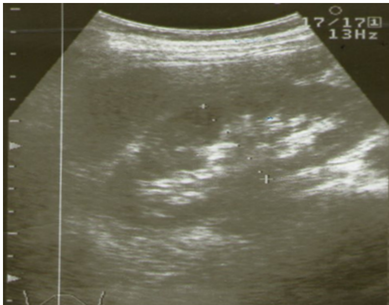
Figura 3. Riñón derecho después del tratamiento quirúrgico

Se discutió en colectivo y se decidió llevarla al salón de operaciones para realizarle la resección del quiste renal derecho a través de la vía laparoscópica con la colocación de tres puertos de acceso transperitoneal; al día siguiente se le dio el alta por su evolución satisfactoria.