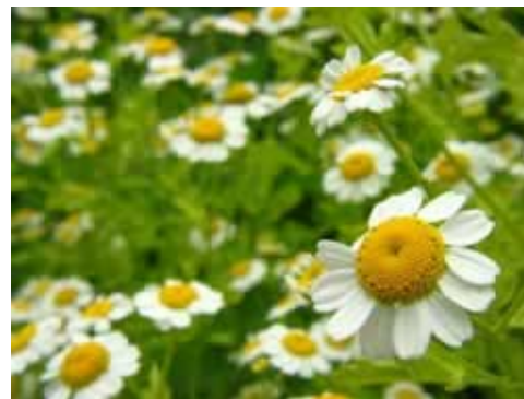
Figura 2. Manzanilla