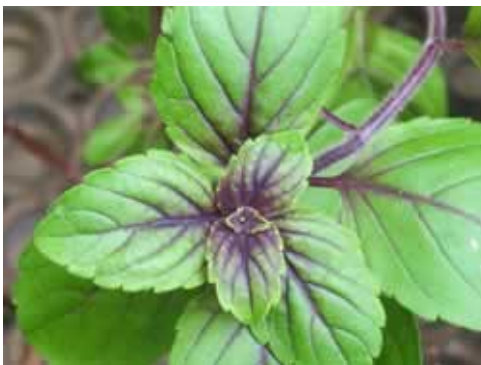
Figura 1. Albahaca morada

Clasificó decenas de plantas medicinales; en este sentido se esforzó por la aclimatación de muchas de ellas y desarrolló trabajos con vistas a la industrialización de los productos, con el fin de crear una verdadera industria químico-farmacéutica en el país. Dentro de dichos estudios es de destacar el realizado con la albahaca morada (figura 1), así como con otras plantas como la manzanilla (figura 2), todo ello en la Sección de Plantas Medicinales de la referida estación. 7,8