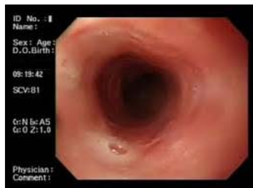
Figura 2. Después del tratamiento