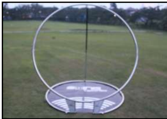
Gambar 2. Produk Awal (Draft Awal) Alat Bantu Mengayun

Setelah melalui tahapan proses desain maka dihasilkan produk awal alat bantu mengayun. Berikut adalah gambar (draft awal) produk alat bantu mengayun yang dikembangkan oleh peneliti sebelum divalidasi oleh para pakar/ahli: