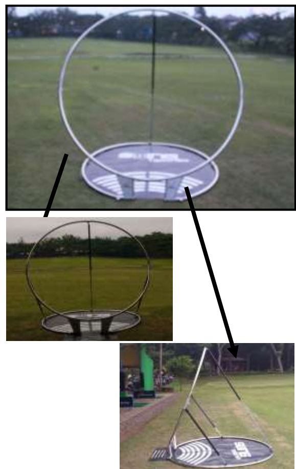
Gambar 3. Draft awal dan draft baru

sebelum dan sesudah direvisi seperti terlihat di bawah ini: