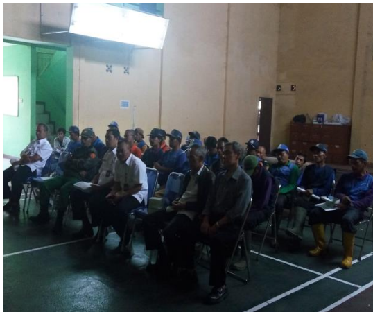
Gambar 4 Peserta Menyimak Pemaparan Materi dari Ketua Tim Pengabdian