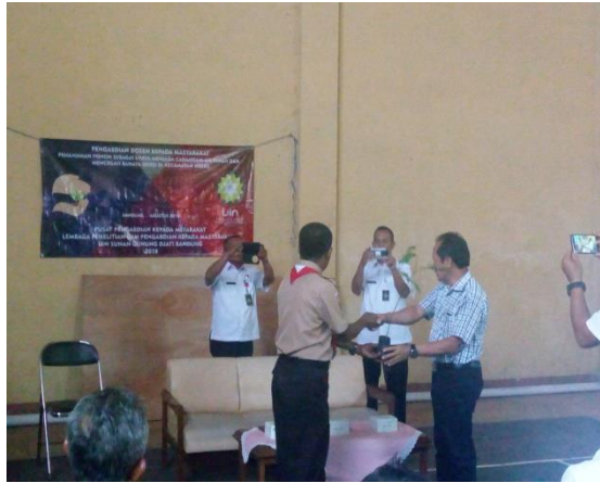
Gambar 3 Serah Terima Secara Simbolis Pohon Pelindung

yang ditanam dapat membantu petani menekan kerusakan tanah akibat erosi.