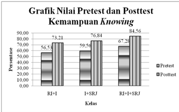
Gambar 1. Grafik Kemampuan Knowing

Skor posttest dan pretest literasi sains pada kemampuan knowing untuk setiap kelas dapat dilihat pada Gambar 1.