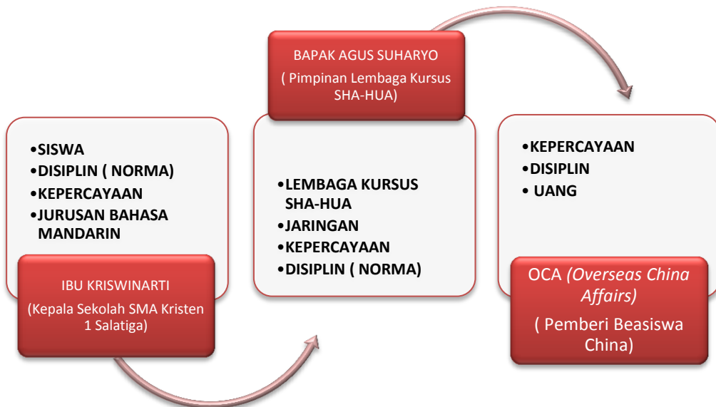
Gambar 1.1 Model “ Trust Capital ” 25

Hal ini tentu berbeda dengan pola kerjasama antar pemerintah yang memulai kerjasama karena kebutuhan dan mitra dari setiap negara. Ini memungkinkan kerjasama tersebut dapat dihentikan kapan saja setelah tidak ada kepentingan lagi atau karena terjadi sengketa atas nama negara. Akan