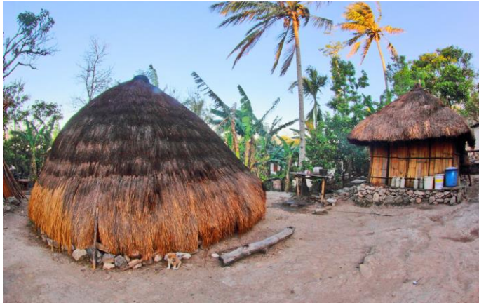
Gambar 1. Bangunan ume kbubu yang terletak di belakang rumah kotak

Berdasarkan fungsinya, ume kbubu (Gambar 1) ini digunakan sebagai dapur keluarga dan juga sebagai tempat tidur keluarga (Dima et al, 2013). Menjelang petang, saat suhu udara mencapai 22^{\circ}\text{C} , orang-orang akan masuk dalam ume kbubu . Tujuan utamanya adalah menyiapkan makan malam dan makan malam bersama. Selain itu mereka akan bercengkrama sembari menghangatkan badan dengan duduk melingkari perapian yang terletak di tengah ume kbubu . Pada waktu tersebut suhu di luar 20 - 19^{\circ}\text{C} dan suhu di ume naek 21 - 20^{\circ}\text{C} , sedangkan suhu di ume kbubu sangat hangat yakni di kisaran 35 - 37^{\circ}\text{C} . Seluruh keluarga akan masuk dalam ume kbubu dan sangat jarang yang tinggal di ume naek untuk menghangatkan diri (Gambar 2).