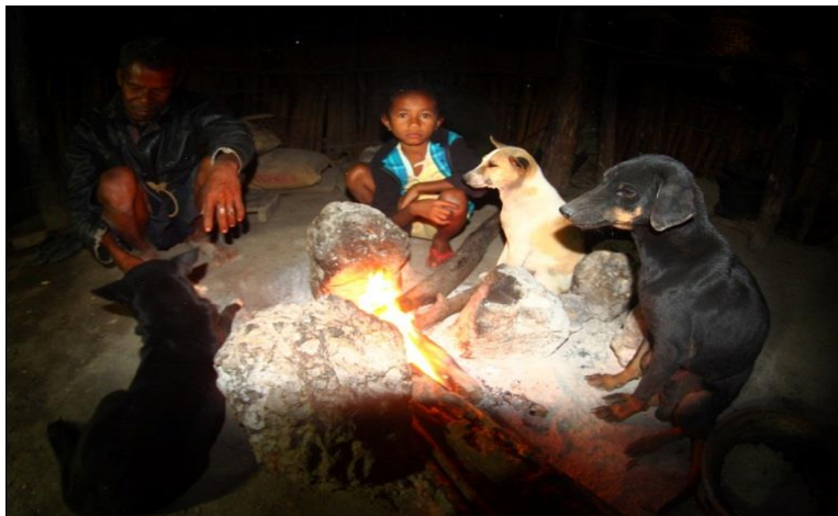
Gambar 2. Aktivitas penduduk pada malam hari dalam ume kbubu .

Berdasarkan fungsinya, ume kbubu (Gambar 1) ini digunakan sebagai dapur keluarga dan juga sebagai tempat tidur keluarga (Dima et al, 2013). Menjelang petang, saat suhu udara mencapai 22^{\circ}\text{C} , orang-orang akan masuk dalam ume kbubu . Tujuan utamanya adalah menyiapkan makan malam dan makan malam bersama. Selain itu mereka akan bercengkrama sembari menghangatkan badan dengan duduk melingkari perapian yang terletak di tengah ume kbubu . Pada waktu tersebut suhu di luar 20 - 19^{\circ}\text{C} dan suhu di ume naek 21 - 20^{\circ}\text{C} , sedangkan suhu di ume kbubu sangat hangat yakni di kisaran 35 - 37^{\circ}\text{C} . Seluruh keluarga akan masuk dalam ume kbubu dan sangat jarang yang tinggal di ume naek untuk menghangatkan diri (Gambar 2).