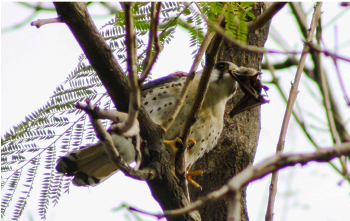
Fig. 2: Un macho adulto de cernícalo Falco sparverius sosteniendo en su pico a un murciélago de cola libre Tadarida brasiliensis , en Santiago, Región Metropolitana, Chile.

Agradecemos a Paulo Dávalos y Taller Siete Colores por facilitarnos la fotografía. Agradecemos también las sugerencias y comentarios del Editor en Jefe de la revista y dos revisores anónimos.