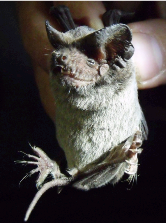
Fig. 3: Macho adulto de murciélago de cola libre Tadarida brasiliensis .