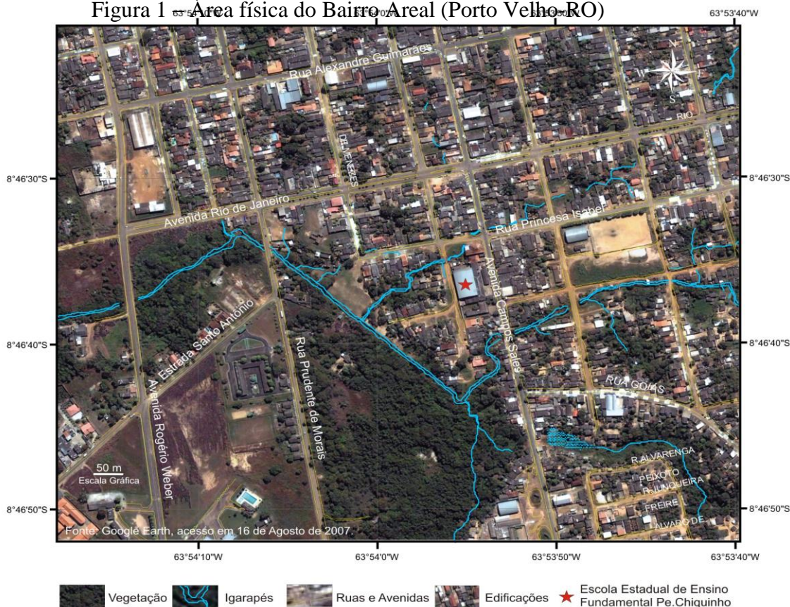
Figura 1 – Área física do Bairro Areal (Porto Velho-RO)

O Bairro Areal limita-se ao norte com o igarapé das lavadeiras a partir da sua intersecção com a Rua Prudente de Moraes seguindo o sentido foz/nascente até sua intersecção com a Rua Brasília, demonstrada na figura 1, os aspectos físicos: