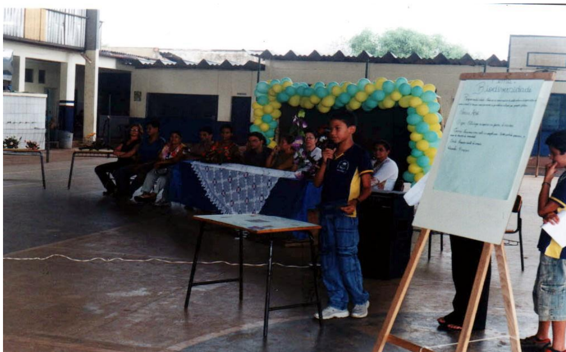
Figura 2 – Aluno expondo trabalho de Educação ambiental na conferência do meio - ambiente