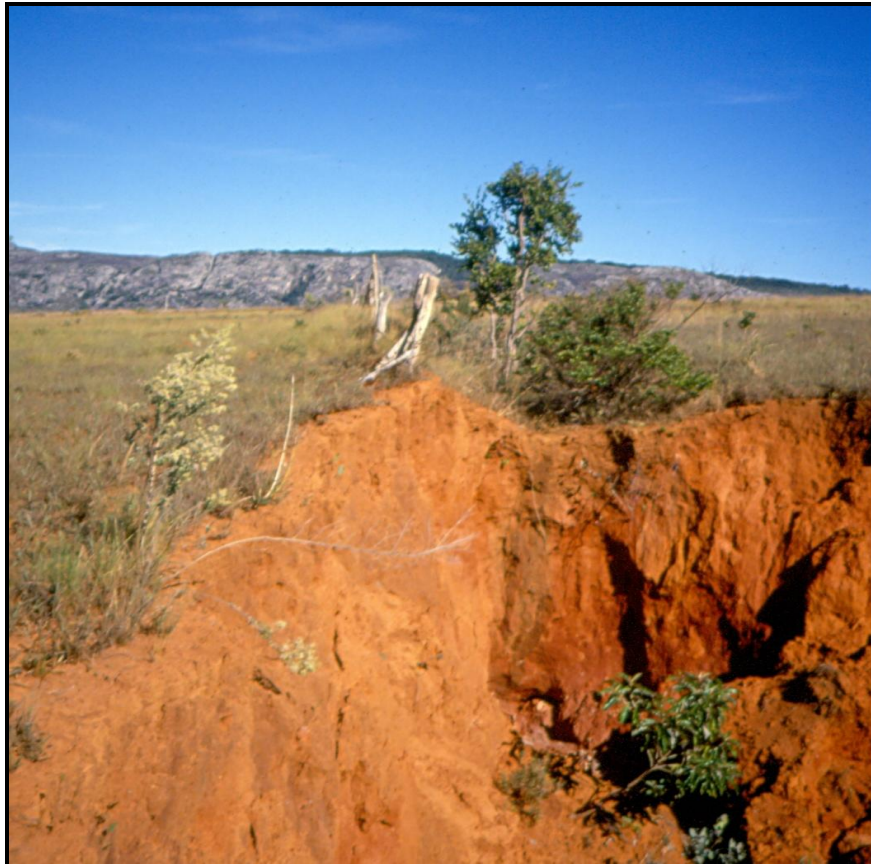
Fig. 4- Presença de voçoroca acompanhando cerca de arame farpado. Notar a presença de pequeno rebaixamento à direta da cerca, que faz sobressair a porção (murundu) na qual os postes da cerca estão assentado. Também se observa a ocorrência de latossolo vermelho, comumente encontrado em rochas básicas e metabásicas.