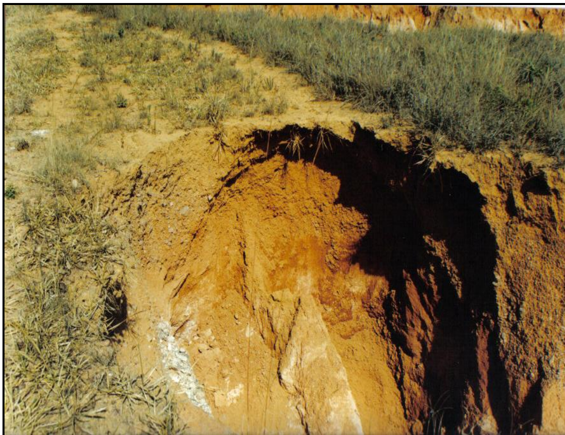
Fig. 5 – Colapso de parte de uma estrada vicinal, como consequência do avanço de ramificação de uma voçoroca por causa do efeito da enxurrada que é canalizada pela estrada.