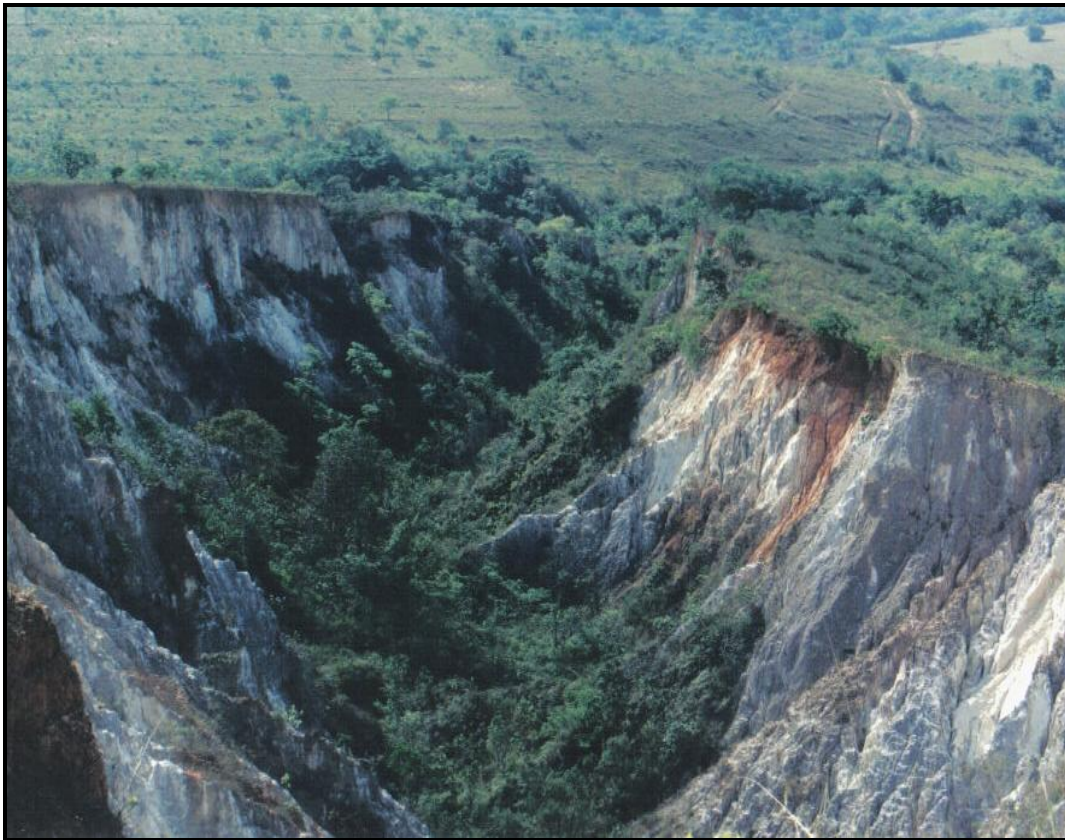
Fig. 3-Voçoroca semicircular, contornando um anfiteatro, formada a partir da abertura de vala para proteger áreas do fundo do excesso de água, bem como do acesso do gado à área antigamente utilizada para o plantio (à direita).

Eram utilizadas ainda como prática de manejo, para retirar o excesso de escoamento superficial nas áreas côncavas do relevo, com a abertura de valas com até 0,5m de profundidade.