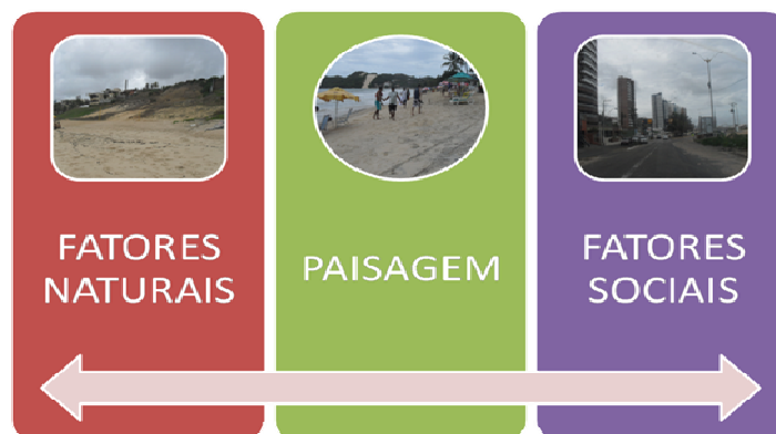
Figura 01: Paisagem – integração entre os fatores naturais e sociais. Foto: Ana Beatriz Câmara Maciel (Dez-2011).

Geografia, considerada como sendo uma fenomenologia das paisagens. Sauer, na sua obra supracitada, foi um dos primeiros geógrafos a tratar a geografia de maneira integrada, privilegiando, ao mesmo tempo, os fatores naturais e sociais, inserindo a compreensão da categoria paisagem como elo integrador desses fatores (Figura 01).