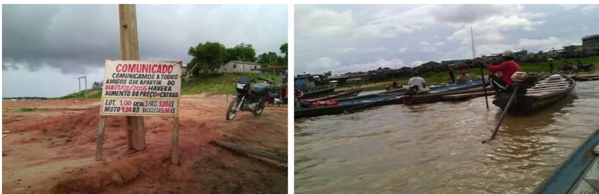
Figura 3: Comunicado das associações aos moradores sobre o aumento de passagem (2015). Autora: Nágila dos Santos Situba, 2016

Quanto ao preço da passagem, esta está relacionada ao preço da gasolina, dependendo do for cobrado pelo combustível nos postos. As associações se reúnem coletivamente e decidem mudanças no quadro de cobrança. Todo esse processo só é possível se a maioria dos associados estiver de acordo. Geralmente, essas mudanças são anunciadas aos moradores do bairro meses antes do preço ser alterado (figura 03). Cabe lembrar que o valor da passagem depende de outros fatores como as dinâmicas da troca, do uso e do trabalho agregado. Em outras palavras, isso implica pensar em qual o total de catraieiros disputando qual número de passageiros para além dos custos com a manutenção e abastecimento de um motor.