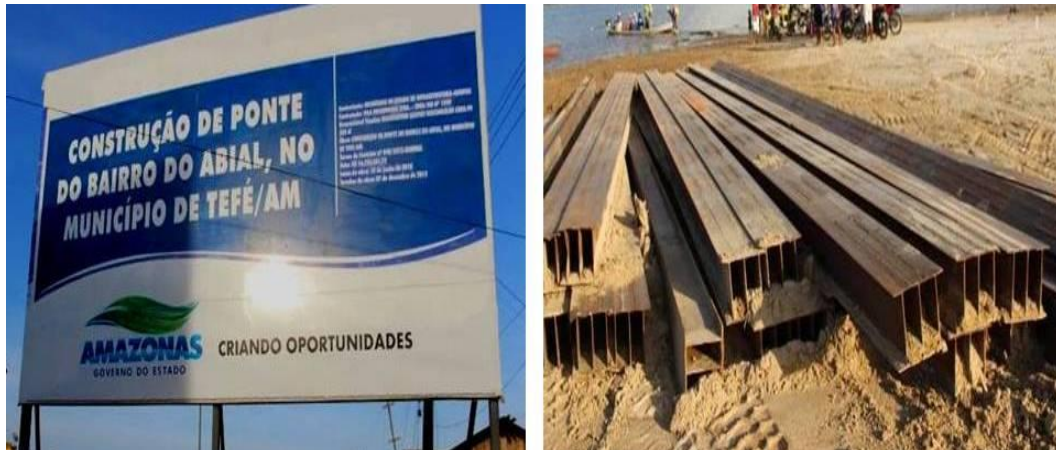
Figura 4: Divulgação da construção da ponte do bairro do Abial. Autora: Nágila dos Santos Situba, 2014

São questionamentos que permeiam antes da construção dela que do ponto de vista dos catraieiros aparece como ameaça enquanto para os moradores, hoje passageiros, transparece como ganho de mobilidade no dia a dia.