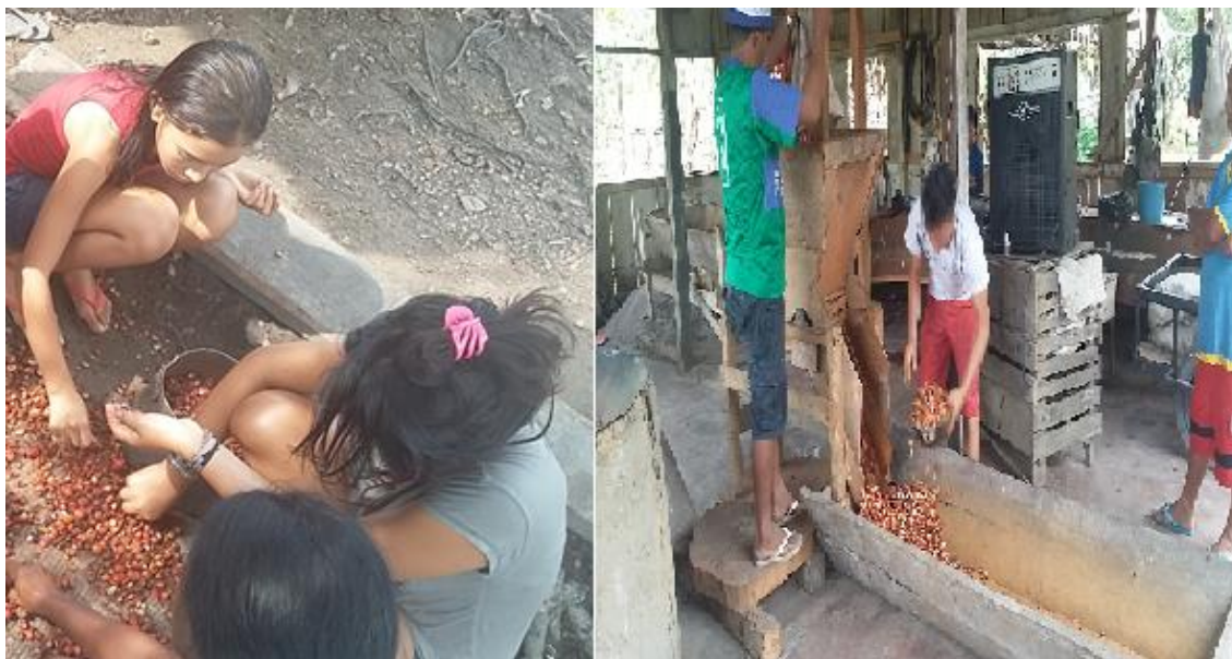
FIGURA 4 - 5: Unidade de produção, temos a família trabalhando manualmente com o guaraná, na figura (5) a presença de máquina, no qual facilita a força de trabalho.