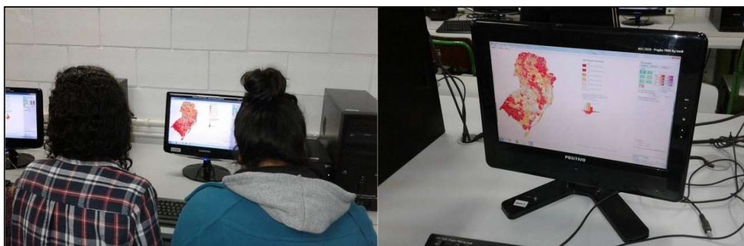
Figura 5: Segundo encontros com os alunos. Fonte: Atividade na escola, 2017.

No terceiro encontro, trabalharam-se como escalas mais próximas: o Estado (Rio Grande do Sul) e o município de Santa Maria (RS). Após os alunos foram desafiados a correlacionar os indicadores sociais trabalhados nas diferentes escalas geográficas, ou seja, destacaram quais as semelhanças e diferenças entre as Regiões do Brasil, o Estado e o Município que residem e estudam. A Figura 5 demonstra a interação de alguns alunos com o programa de mapeamento.