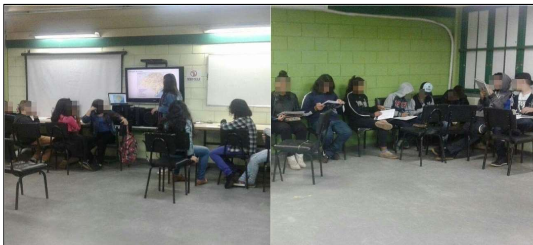
Figura 4: Primeiro encontro com os alunos. Fonte: Atividade na escola, 2017.

Então, se fez uma breve apresentação sobre o que é o Philcarto e sobre suas possibilidades de uso na Geografia. Posteriormente, foi aplicado um questionário para conhecer as práticas de interação tecnológica dos alunos, bem como verificar sua familiaridade ou não com as tecnologias. O questionário foi aplicado às quatro turmas de 7º ano da escola, 7º verde (13 alunos), 7º laranja (17 alunos), 7º amarelo (18 alunos) e 7º azul (16 alunos) 4 .