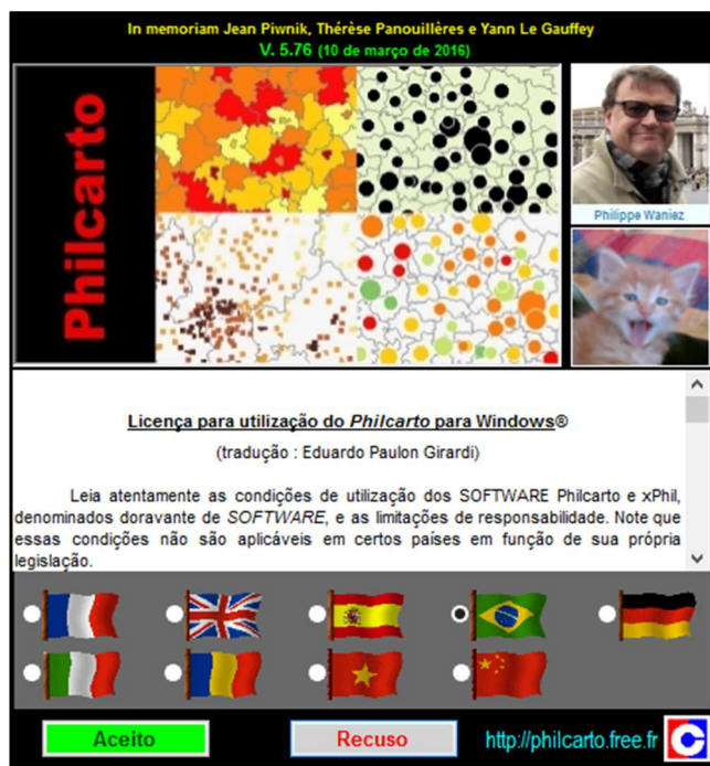
Figura 1: Interface inicial do software Philcarto .

O software conta com versão em nove idiomas, como apresenta a Figura 1, dentre elas a língua portuguesa. A partir do Philcarto , os educandos podem elaborar diversos mapas temáticos: mapas de setor, de figuras proporcionais, coropléticos, pontos de contagem, entre outros. Além disso, o programa apresenta recursos cartográficos e estatísticos, que podem ser explorados pelos professores e pelos alunos, incorporando (novas e mais complexas) análises aos conhecimentos geográficos trabalhados (FRANCA; LIMA; RIBEIRO, 2011). Cabe ressaltar que segundo a Licença para utilização do Philcarto para Windows®, na publicação do mapa elaborado com o software se deve apresentar que foi “Elaborado com Philcarto : http://philcarto.free.fr ” e que todos os direitos de propriedade e autorais frente ao Philcarto são de Philippe Waniez .