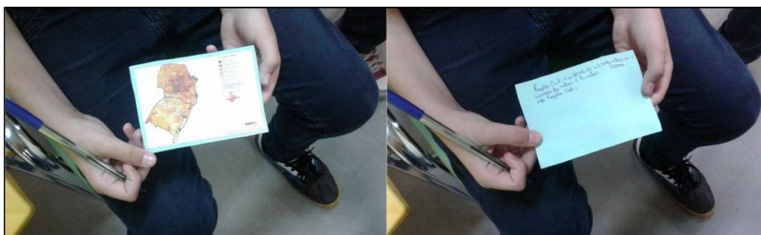
Figura 8: Dinâmica Final do Projeto.

Após isso, desenvolveu-se uma dinâmica de finalização do projeto. Primeiramente, foi projetado em Power Point o mapa do Brasil construído por um dos educandos e os mesmos foram desafiados a mostrar/dizer aproximadamente aonde é a localização do município de Santa Maria (RS), bem como tecer uma interpretação sobre o indicador social (População Responsável) presente no mapeamento. Após, cada aluno ganhou um mapa (havia oito tipos de mapas diferentes na sala) e teve que escrever qual a escala do mapa (municipal, estadual, regional ou nacional) e qual indicador social o mesmo estava mapeando, além de explicar o que poderia ser observado na representação gráfica, conforme evidência a Figura 8. Os alunos que acertarem pelo menos um dos quesitos solicitados ganharam como prêmio um pirulito.