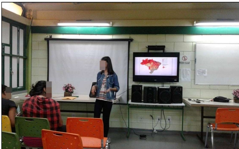
Figura 7: Quarto encontro com os alunos.

Após isso, desenvolveu-se uma dinâmica de finalização do projeto. Primeiramente, foi projetado em Power Point o mapa do Brasil construído por um dos educandos e os mesmos foram desafiados a mostrar/dizer aproximadamente aonde é a localização do município de Santa Maria (RS), bem como tecer uma interpretação sobre o indicador social (População Responsável) presente no mapeamento. Após, cada aluno ganhou um mapa (havia oito tipos de mapas diferentes na sala) e teve que escrever qual a escala do mapa (municipal, estadual, regional ou nacional) e qual indicador social o mesmo estava mapeando, além de explicar o que poderia ser observado na representação gráfica, conforme evidência a Figura 8. Os alunos que acertarem pelo menos um dos quesitos solicitados ganharam como prêmio um pirulito.