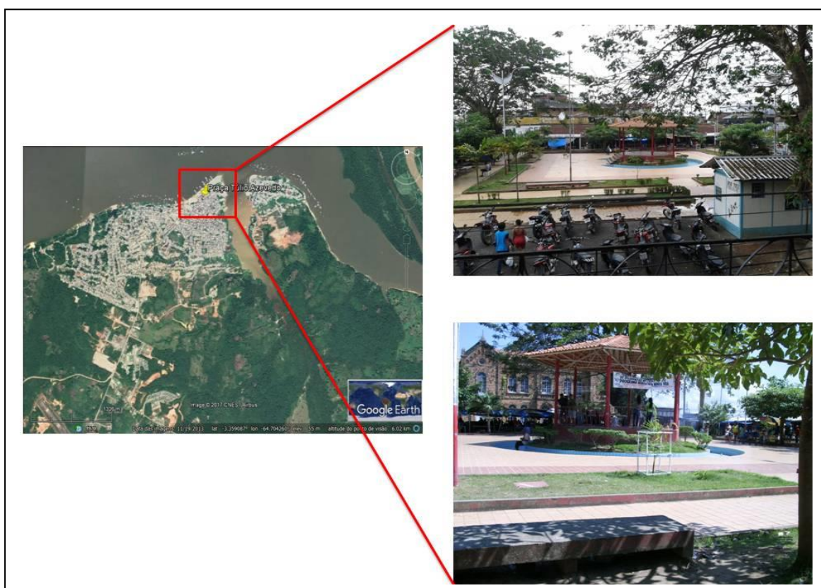
Figura 3. Imagem da Praça Túlio Azevedo (no centro da praça um cloreto). Foi difícil a identificação de pessoas em situação de rua. Dos que foram identificados costumavam dormir no coreto com a intenção de se protegerem do sol ou da chuva. Organização: Nágila Situba.

Durante o tempo em Tefé (fig. 3) foi possível identificar dois senhores que aparentavam estar em situação de rua. Estes foram vistos no final da tarde de sexta-feira do dia 09 de setembro e desde então não foram mais vistos.