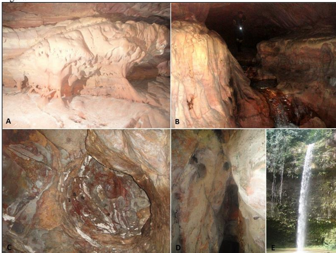
A: formação do pipping; B: córrego endocárstico; C: cúpula no teto por gotejamento; D: abertura de fratura por pipping; E: paredão de arenito.