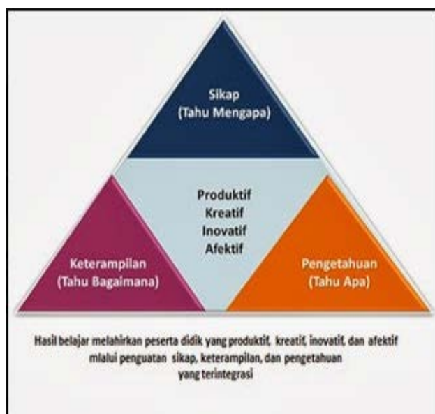
Gambar 1.1 Piramida Kemampuan Peserta Didik

Kurikulum 2013 menekankan pada dimensi pedagogik modern dalam pembelajaran, yaitu menggunakan pendekatan ilmiah. Pendekatan ilmiah (scientific approach) dalam pembelajaran sebagaimana dimaksud meliputi mengamati, menanya, mencoba, mengolah, menyajikan, menyimpulkan, dan mencipta untuk semua mata pelajaran. Untuk mata pelajaran, materi, atau situasi tertentu, sangat mungkin pendekatan ilmiah ini tidak selalu tepat diaplikasikan secara prosedural. Pada kondisi seperti ini, tentu saja proses pembelajaran harus tetap menerapkan nilai-nilai atau sifat-sifat ilmiah dan menghindari nilai-nilai atau sifat-sifat nonilmiah.