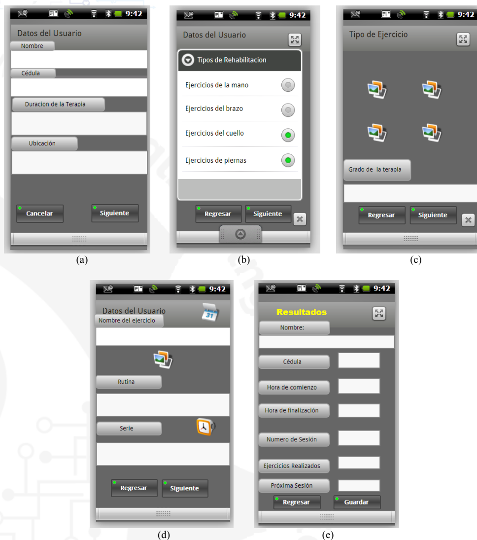
Figura 3. a. Captura de datos del paciente, b. Captura del tipo de ejercicio, c. Selección del grado o dificultad de la terapia, d. Captura de los datos resultantes del ejercicio: serie y rutina, e. Muestra de resultados.

Previamente el paciente debió indicar al momento de llenar sus datos, cuanto fue el periodo que el especialista le recomendó a hacer la terapia. Esto se hará, porque la aplicación también servirá como asistente y le recordará al paciente, periódicamente, el momento que debe empezar a realizar la sesión.