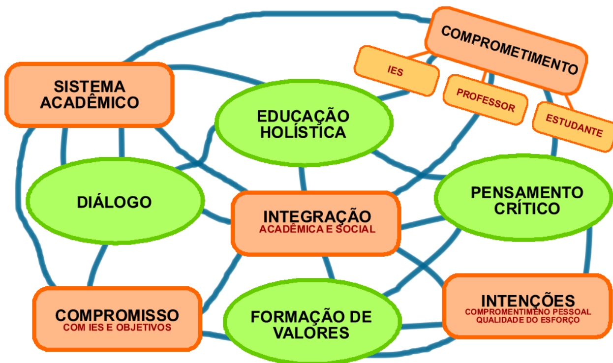
Figura 3 – Modelo para a permanência vinculado a educação para cidadania global