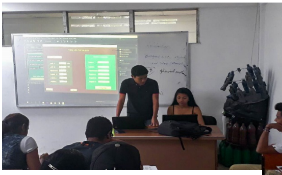
Figura 8. Estudiantes probando la aplicación.

Sin embargo, la aplicación fue recibida de una manera muy positiva.