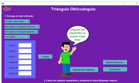
Figura 2. Interfaz gráfica para el ingreso y comprobación de triángulos oblicuángulos.