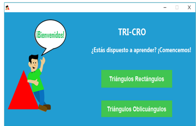
Figura 1. Menú principal de TRI-CRO.

“La tecnología orientada a objetos se define como una metodología de diseño de software que modela las características de objetos reales o abstractos por medio del uso de clases y objetos” [8].