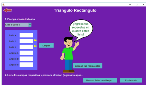
Figura 3. Interfaz para el ingreso de datos y comprobación de triángulos rectángulos.