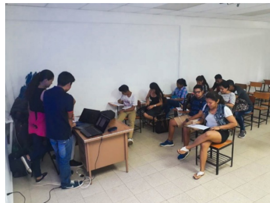
Figura 7. Estudiantes encuestados.

Luego, se realizó dos encuestas con una muestra de 20 estudiantes de primer año de la Universidad Tecnológica de Panamá C.R. de Coclé dentro de la asignatura Matemáticas I, para obtener información acerca de la razón principal por la cual se les dificulta el aprendizaje de las matemáticas, también, si una herramienta tecnológica podría motivar y ayudar a comprender mejor esta materia, por último, se midió la efectividad de la aplicación, permitiendo a los estudiantes el uso de ella.