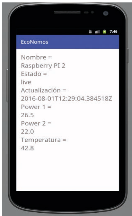
Figura 2. Interfaz gráfica del sistema.

En la figura 2 se ilustra el diseño del prototipo funcionando en el emulador del entorno de Android Studio.