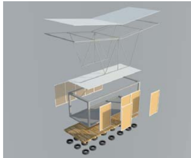
Figura 3. Prototipo 1. Desglose.

El desarrollo del prototipo inicial comienza revisando las condicionantes de diseño establecidas anteriormente según las investigaciones previas y el estudio de diferentes casos. De estas condicionantes y parámetros se realiza una jerarquización de las mismas para atenderlas de una mejor manera y facilitando además, el proceso de diseño, como se muestra en la figura 3.