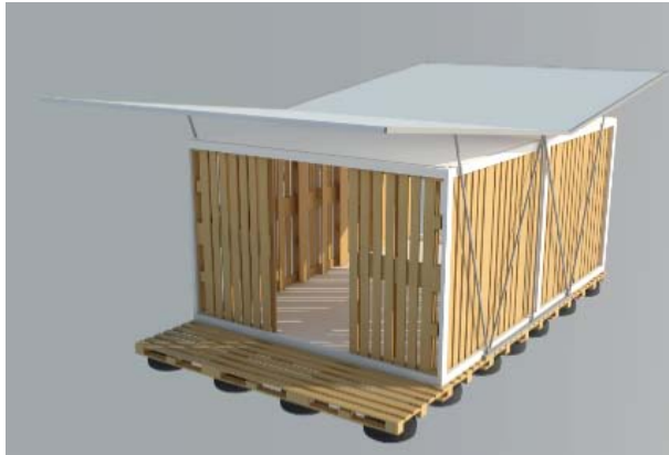
Figura 7. Prototipo 3.