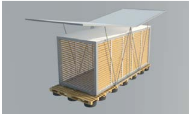
Figura 4. Prototipo 1. Desglose.

Pensando en la reducción de la carga térmica, la mejor opción para el cerramiento del recinto era la madera que, debido a su versatilidad de formas, el transporte no presentaría problemas.