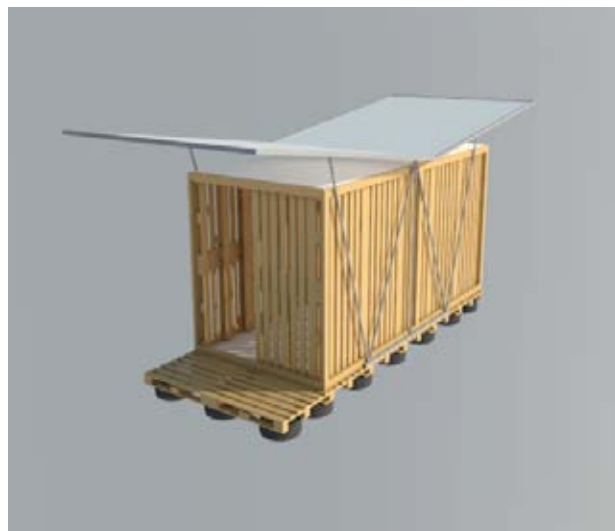
Figura 6. Prototipo 2.

Para resolver esto se creó un elemento que se atornille al piso del recinto, o a cualquier superficie plana, y que este sirva de guía y fundación para anclar los elementos de la cercha. Una vez que se tienen las dos cerchas en su lugar se colocan los elementos de la cubierta, uniéndolas por pernos a la cercha. Por último se coloca la lona tensada (ver figura 6).