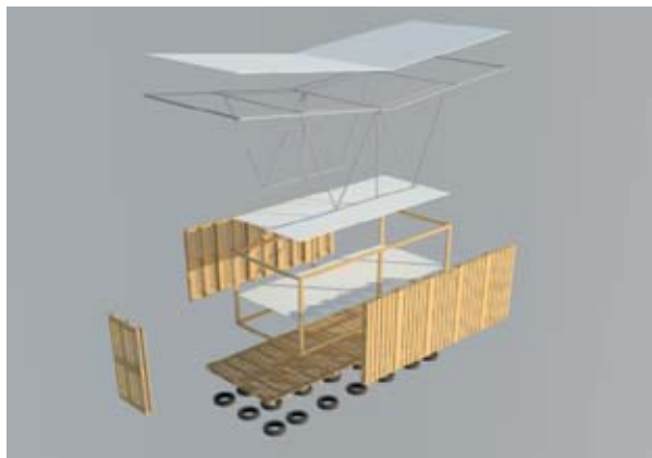
Figura 5. Prototipo 2. Desglose.

Para las fundaciones del prototipo (figura 5) se propone usar neumáticos viejos llenos de arena o barro y apoyar sobre los mismos pallets de madera. Esta solución resulta como una de las mejores investigadas, primeramente por el fácil manejo de los materiales durante su fabricación, además del carácter reciclado de los mismos y su fácil obtención en el territorio.