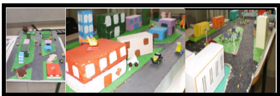
Figura 2: Maquetes construídas pelos estudantes.