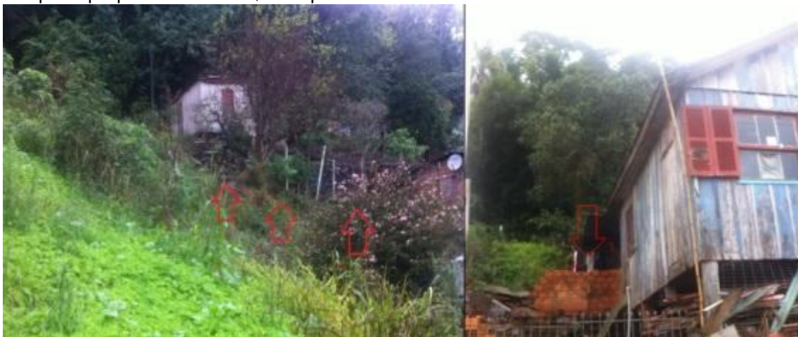
Figura 5 – Construções de muros para conter os sedimentos, notadamente são muros construídos pelos próprios moradores, não apresentando uma estrutura bem consolidada.

Após a análise das áreas de risco presentes dentro da APA foi elaborado o mapeamento da vulnerabilidade da população que reside no local, subsidiando, assim, futuras discussões de ordenamento e planejamento territorial dentro da UC.