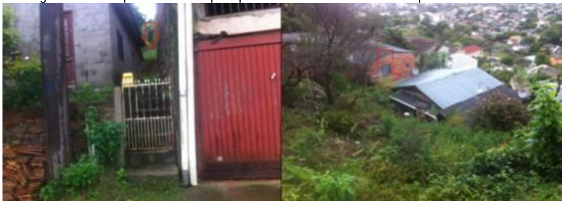
Figura 3 – Exemplos de locais que apresentam cortes na vertente próximos a moradia

Ainda no morro Cechela, as vertentes íngremes apresentam rochas expostas, onde a ação da água nas fraturas das rochas pode desencadear tombamentos e quedas de blocos. Já nas porções mais baixas da vertente ocorrem depósitos de colúvio e depósitos de rejeito sujeitos a escorregamentos (figura 4).