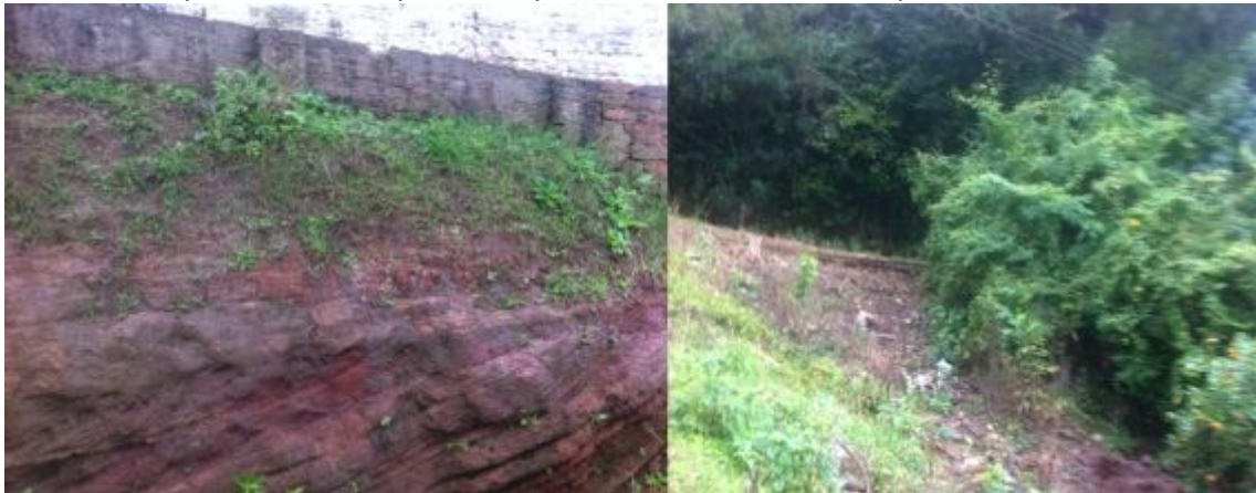
Figura 4 – a foto a esquerda demonstra a rocha exposta com material de colúvio. A foto a direita ilustra o transporte de sedimentos e seu depósito na parte inferior, esse material que vai sendo depositado apresenta-se de forma susceptível.

O que mais chama a atenção na área estudada é ver que o próprio homem tenta resolver os problemas de engenharia para estabelecer suas residências. Como a área do Rebordo possui grandes declives, os terrenos apresentam intensos processos erosivos, deste modo, a construção de muros para tentar conter o material que desce a encosta é perceptível na maioria dos terrenos (figura 5).