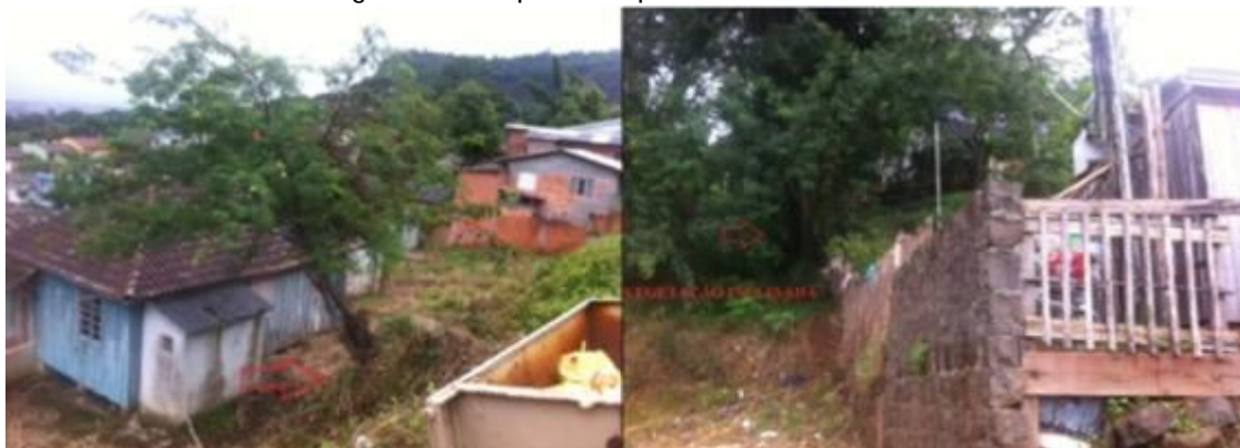
Figura 2 – Índicios de rastejos com vegetação inclinada e a possibilidade clara de ocorrer o escorregamento no primeiro patamar do morro Cechela.

Outra condicionante que pode ser observada em campo foram os cortes feitos na vertente para estabelecer as moradias. Em alguns casos o corte se localiza muito próximo às residências (figura 3). Os cortes associados a declividades acentuadas que a área apresenta tornam o cenário como de risco iminente.