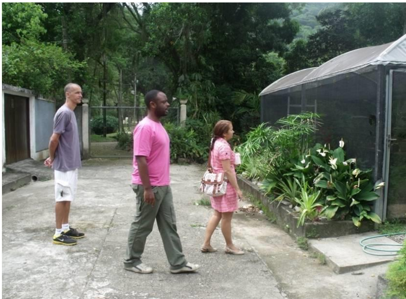
Figura 5. Visita à área de produção de mudas para reposição do Jardim Sensorial do Jardim Botânico do Rio de Janeiro.

Ao visitar o Jardim Sensorial da Amazônia (Belém/PA) pode-se constatar a utilização de espécies regionais em substituição as espécies exóticas, cujas mudas de substituição são provenientes do horto municipal da Prefeitura de Belém/PA. No Jardim Botânico do Rio de Janeiro as mudas para substituição são produzidas num viveiro existente na área administrativa por reprodução vegetativa ou por semeadura (Figura 4).