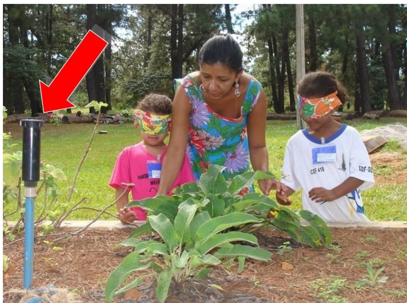
Figura 4. Destaque (seta) para estrutura de irrigação do canteiro do Jardim Sensorial do Jardim Botânico de Brasília.

dificuldade para a manutenção é a irrigação dos canteiros. A correta adequação do sistema de irrigação permite uma manutenção mais preventiva no Jardim Sensorial, porém dos três espaços visitados, somente o jardim Botânico de Brasília apresentou tal preocupação em sua estrutura física (Figura 3), onde se destaca a presença de espécies típicas do cerrado da região Centro-oeste do Brasil, além da concepção arquitetônica baseada no princípio da permacultura.