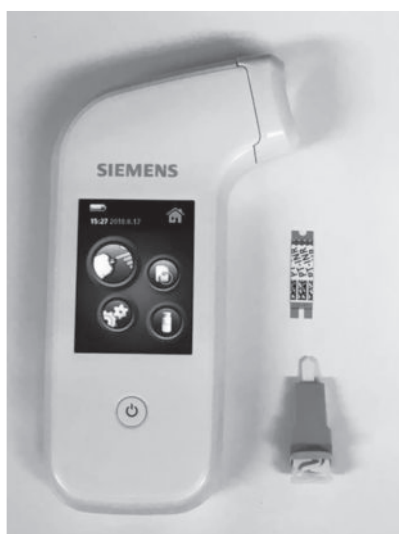
図1 血液凝固分析装置 エクスペシアストライド®

は休薬せず継続のまま施行できる。チエノピリジン誘導体はアスピリンあるいはシロスタゾールに置換し継続する。その他の抗血小板薬は出血高危険度処置では休薬する。