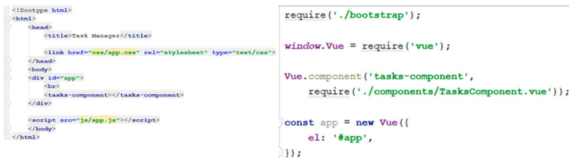
Рис. 7. На левой стороне изображения index.blade.php, а с правой app.js

Окромя, написание кода в vuejs компоненте, нам также необходимо его инициализировать в index.blade.php файле представленный, заранее установив его в vuejs обработчике. На рис. 7 можете видеть файл index.blade.html и app.js.