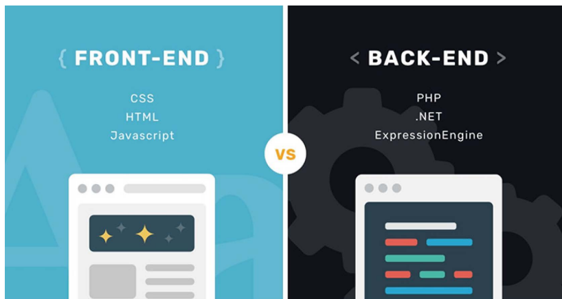
Рис. 1. Краткий список областей веб приложения с включающими в себя языками

Рядовые пользователи, заходя на тот или иной сайт, даже могут не задумываться как он на самом деле работает, какие механизмы он использует, на какие составляющие он делится и какое количество человек разрабатывало данный сайт. Веб приложения делятся на две составляющие, это Front-End (передний план или по-другому – пользовательская часть) и Back-End (задний план, серверная часть). На рис. 1 изображены области веб сайта с включающими в себя языков программирования [12, с. 16].