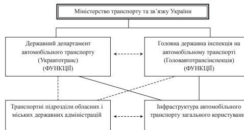
Рис. 2. Блок-схема організаційної структури управління автомобільним транспортом загального користування.

У липні 2004 р. Указом Президента України Міністерство транспорту України і Державний комітет зв'язку та інформатизації України були реорганізовані у Міністерство транспорту та зв'язку України.