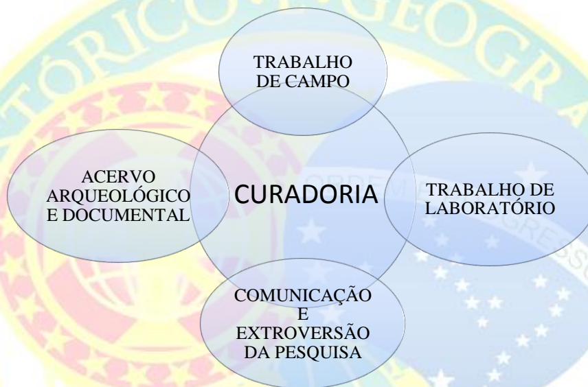
Figura 1: Cadeia operatória do processo curatorial.