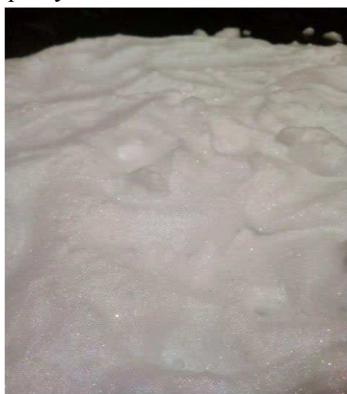
Рис. 1. Загальний вигляд компресійної піни, діаметр бульбашок від 0,08 до 0,2 мм

ньої та низької кратності піноутворювачів загального призначення знаходиться у межах від 2 до 5 мм. Використовуючи спеціальні ПУ, можливо отримувати таку піну з розмірами бульбашок від 1,8 до 2,5 мм. Щодо однорідності бульбашок – інформація не надається. Згідно з інформацією в іноземних джерелах, орієнтовний розмір бульбашок КП повинен бути не більше ніж 0,6–0,8 мм. Автори (Dogaç, 2012) стверджують, що "піна хорошої якості є однорідна, складається з дуже маленьких бульбашок, які, наприклад, мають середній еквівалентний діаметр в інтервалі від 0,5 до 1 мм". У попередніх дослідженнях (Nikulin, Kodrik & Titenko, 2018) отримана нами КП складалася з бульбашок діаметром від 0,08 до 0,2 мм, (рис. 1), що значно менше від зазначених вище і що повинно позитивно впливати на характеристики якості піни, наприклад на її стійкість. Стійкість такої компресійної піни повинна зростати під час зменшення діаметра бульбашки.