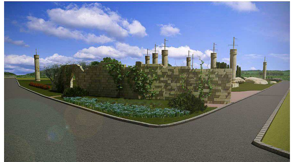
Рис. 3. Квітник на розі біля в'їзду

проліскою дволистою (лат. Scilla bifolia ) та нарцисом вузьколистим (лат. Narcissus poeticus ). Квітник має оточити ялівець лускатий (лат. Juniperus squamata 'Blue Carpet') і костриця валісска (лат. Festuca valesiaca ) (рис. 3).