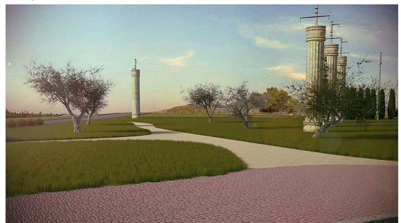
Рис. 4. Стовпи електромереж, стилізовані під давньогрецькі колони

Фоном квітника буде декоративна стіна, увита виноградом Віча. Далі по східній експозиції ділянки вздовж дороги за декоративною стіною заплановано розташувати майданчик, що має нагадувати частину агори і бути викладеним зі стилізованої бруківки. У північно-західному напрямку від нього спроектовано "зарослу" доріжку з дрібного щебеню, що пройде крізь рядове насадження маслинки вузьколистої (лат. Elaeagnus angustifolia ), що додасть ще більше "грецького" колориту. Розташовані в центрі ділянки стовпи ЛЕП, за проектом, мають бути стилізовані під стародавні колони і повиті виноградом Віча (лат. Parthenocissus Veitchii ) (рис. 4).