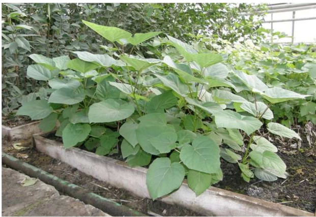
Рис. 4. Вегетація двомісячних живців C. hybrida

На рис. 4 представлено вегетацію двомісячних живців C. hybrida .