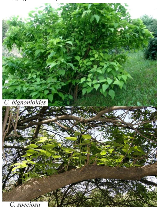
Рис. 1. Швидкий ріст та розвиток дерева порівняно з іншими особинами цього виду (м. Черкаси, парк "Хіміків")

Вперше в умовах Правобережному Лісостепу України проведено дослідження з визначення регенераційної здатності зелених живців видів роду Catalpa , визначено оптимальні розміри живців, терміни їхньої заготівлі та способи укорінення. Живці заготовляли з різновікових насаджень. Вибір материнських особин здійснювали, керуючись візуальними показниками, зокрема швидкий ріст та розвиток дерева порівняно з іншими особинами цього виду (рис. 1 і 2).