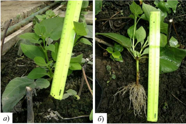
Рис. 3. Початок вегетації та формування кореневої системи C. hybrida : а) укорінений живець у субстраті; б) живець після відмивання кореневої системи

На рис. 4 представлено вегетацію двомісячних живців C. hybrida .