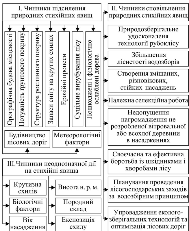
Рис. 2. Схема взаємодії чинників щодо виникнення, підсилення та стабілізації стихійних явищ у Карпатах