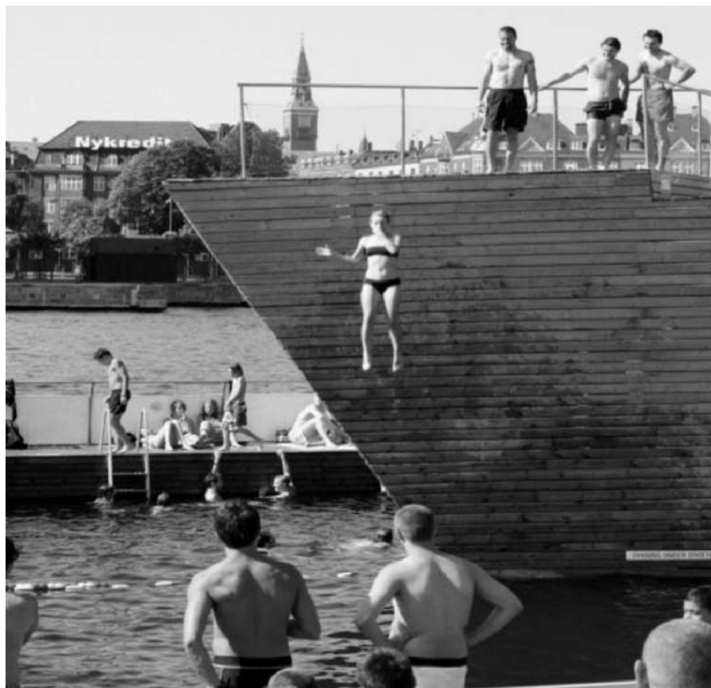
Badelivet ved havnebadet på Islands Brygge.

året, styrketræning eller aerobic i fitnesscentret og måske svømning i ny og næ i svømmehallernes offentlige åbningstider. Men man kunne også sagtens forestille sig det uorganiserede idrætsliv kombineret med foreningsidræt. Yderligere vil typen formentlig sætte pris på skøjtebaner og havnebade i byens rum, hvor man kan se andre og selv blive set uden yderligere involvering. 53