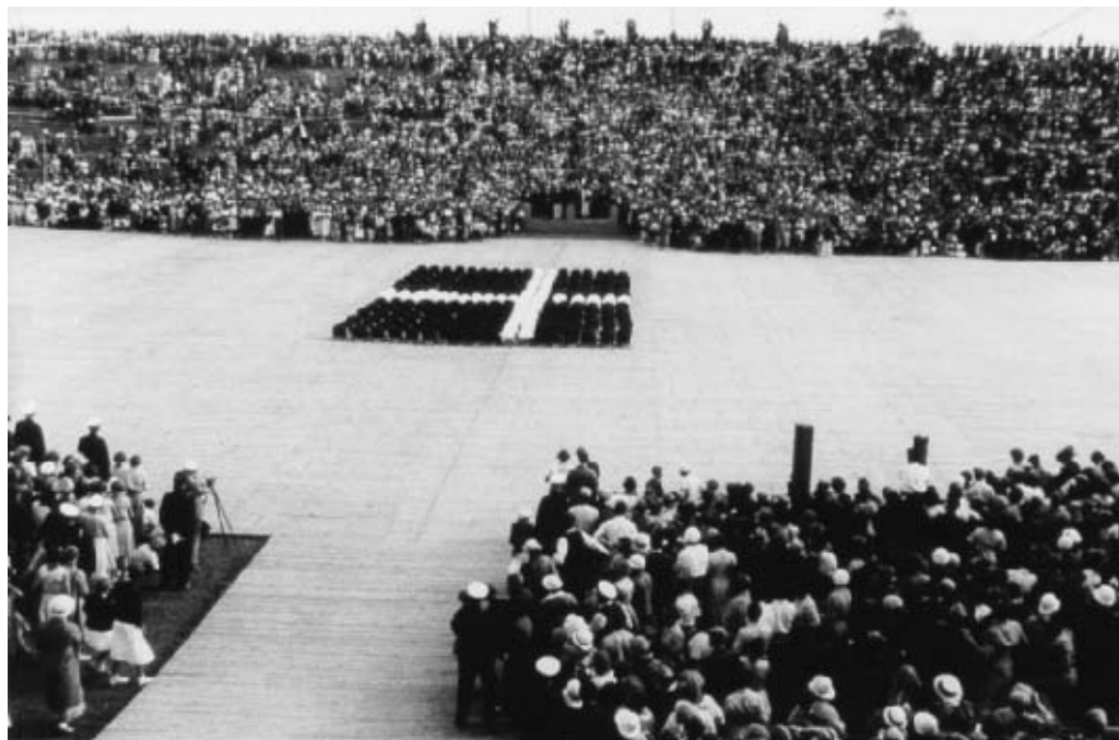
»Det levende dannebrog« foran kongelogen.