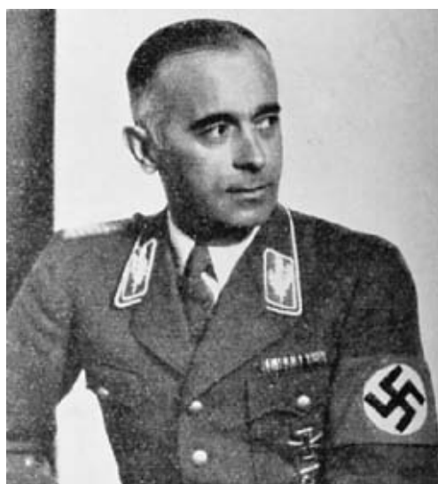
Rigssportsfører von Tschammer und Osten.

Ud over afblæsningen af von Tschammers besøg blev en anden mulig sammenknytning mellem nazisme og landsstævne heller ikke realiseret. Bukh måtte på grund af deltagelse på danmarksdagen ved Verdensudstillingen i Bruxelles den 15. juni, og 14 dage senere ved Verdensudstillingens internationale gymnastikdag, 58 afslå