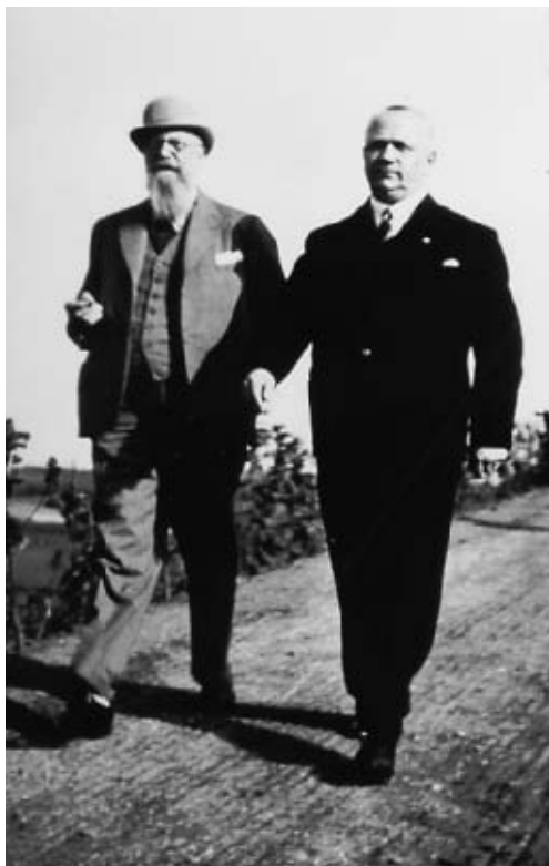
Stauning ved besøg på Gymnastikhøjskolen med udenlandske ministre i midten af 1930'erne. De to går ved siden af hinanden, uden at der spores nogen særlig kontakt. Bukh bragte først fotografiet i årsskriftet for 1950.

lers indflyvning til Nürnbergerpartidagene, som »Guden, der stiger ned fra himlen«. 55