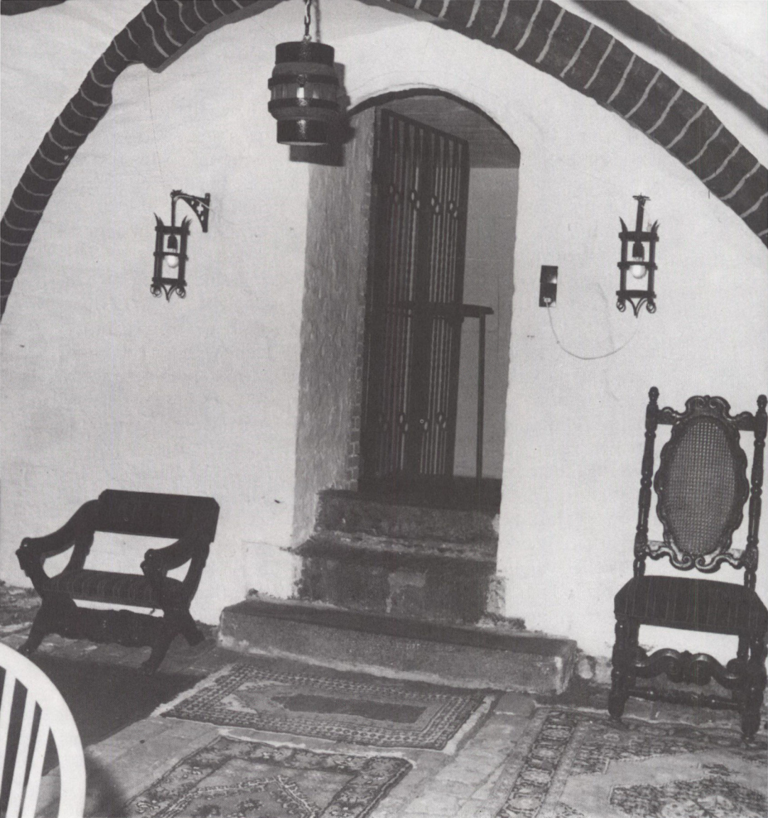
Under forretningen »Osteklokken«, Apotekergade 11, der ligger lige over for hovedindgangen til Haderslev domkirke, findes det middelalderlige lektorium, der under reformationen blev Nordens første evangelisk-lutherske præsteskoie.

En stor del af det slesvig-holstenske ridderskab var nemlig fortsat gammeldags troende, og mange havde slægtninge inden for højgejstligheden. Slesvigs biskop fra 1507 til sin død i 1541, Gosche Ahlefeldt, tilhørte således ridderskabets på den tid fornemste slægt.