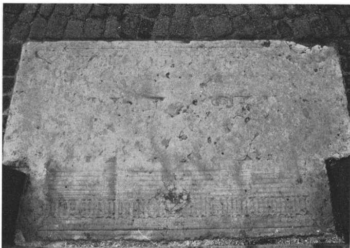
Stenens nuværende plads i tårndøren. Foto 1974.