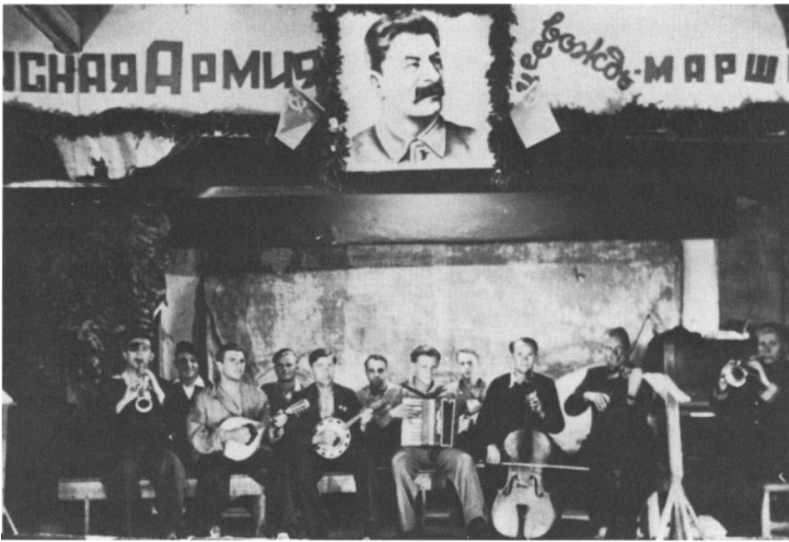
Lejrorkesteret på tribunen i kulturbarakken.