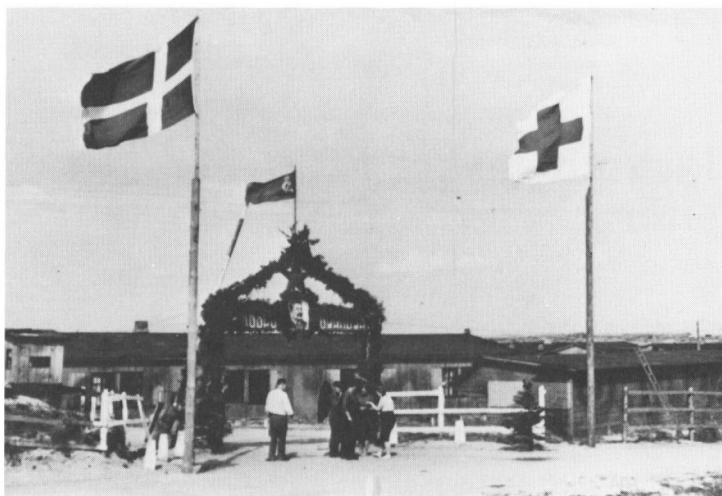
Indgangsportalen til Blåvandlejren. Til venstre vagtstuen, til højre barakken hvor min mor og jeg boede.

vidste noget om krigsfangelejrene i Ribe amt. Nu ville han også have mine oplevelser fra mit sommerophold i lejren ved Blåvand, dengang for 40 år siden, da Danmark blev frit.