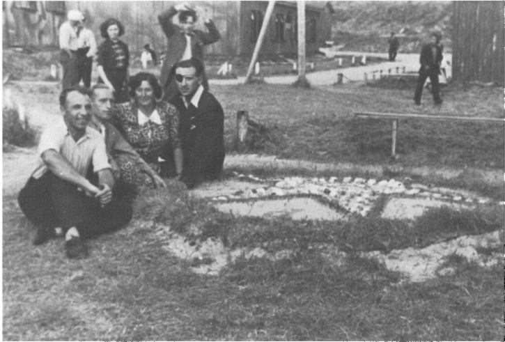
Lejrgaden med udsmykning og min mor med alle vennerne.