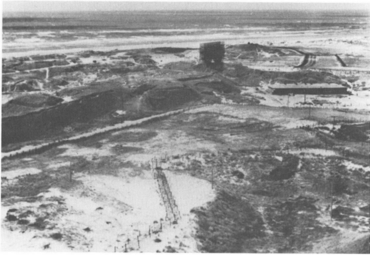
Minefelter og pigtrådshegn i nærheden af Blåvandlejren. I baggrunden en af de store flyradarer.

11. Juli 45: Først var jeg lidt skuffet over, at jeg ikke fik en Røde-kors-Uniform eller i det mindste et Armbind, men nu kan jeg godt se Fordelen ved at være Anonym og saadan lidt uden for Nummeret: Russerne snakker til mig, som om jeg var een af deres egne. Paa den Maade faar jeg opsnappet en hel Del Brokker. Min Mor er sur, når jeg bruger dem, for de er godt saftige. Der sniger sig nu ogsaa en hel masse almindelige Ord med ind, der kan bruges til at komme i Kontakt med Russerne. Der er en lille Gruppe »skrappe Dreng« », der tager paa Strejfture ud i Klitterne, som jeg især godt kunne tænke mig at komme i Lag med.