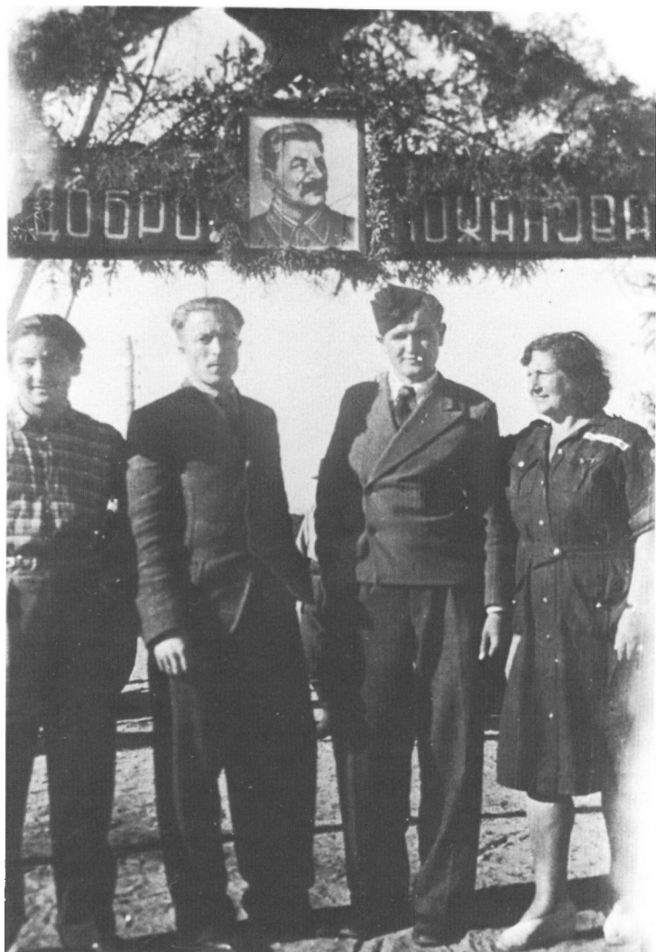
Vore venner i deres nysyede tyske uniformer.