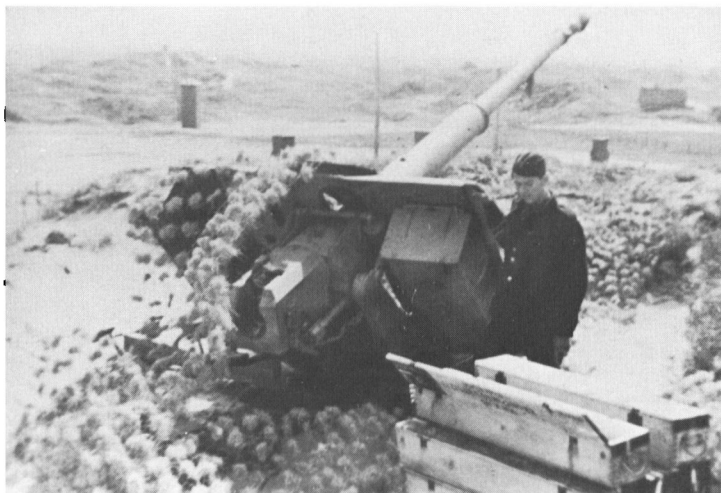
Efterladt kanon og ammunition ude i klitterne ved Blåvand.