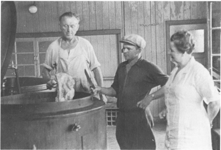
Køkkenet i lejren. Økonomaen overvåger madlavningen.

Førerhuset. Hvis man kan redde sig en Plads paa Forskærmen (og holde godt fast i Forlygterne), slipper man for at blive lige saa støvgraa i Ansigtet som dem, der faar plads paa Ladet. Der er allerede en Del andre Danskere i Lejren. De er kommet nogle Uger før os. En flot Sygeplejerske i en smart, blaa-hvid Uniform, en Økonoma og nogle andre der leder Lejren eller holder Regnskab og saadan noget.