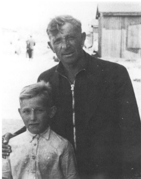
Æjrskomageren med en af 'e blonde små ariere, der kulle have været forandret ra russer til tysker.