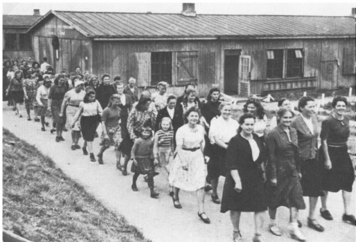
Kvinder på motionsmarch.