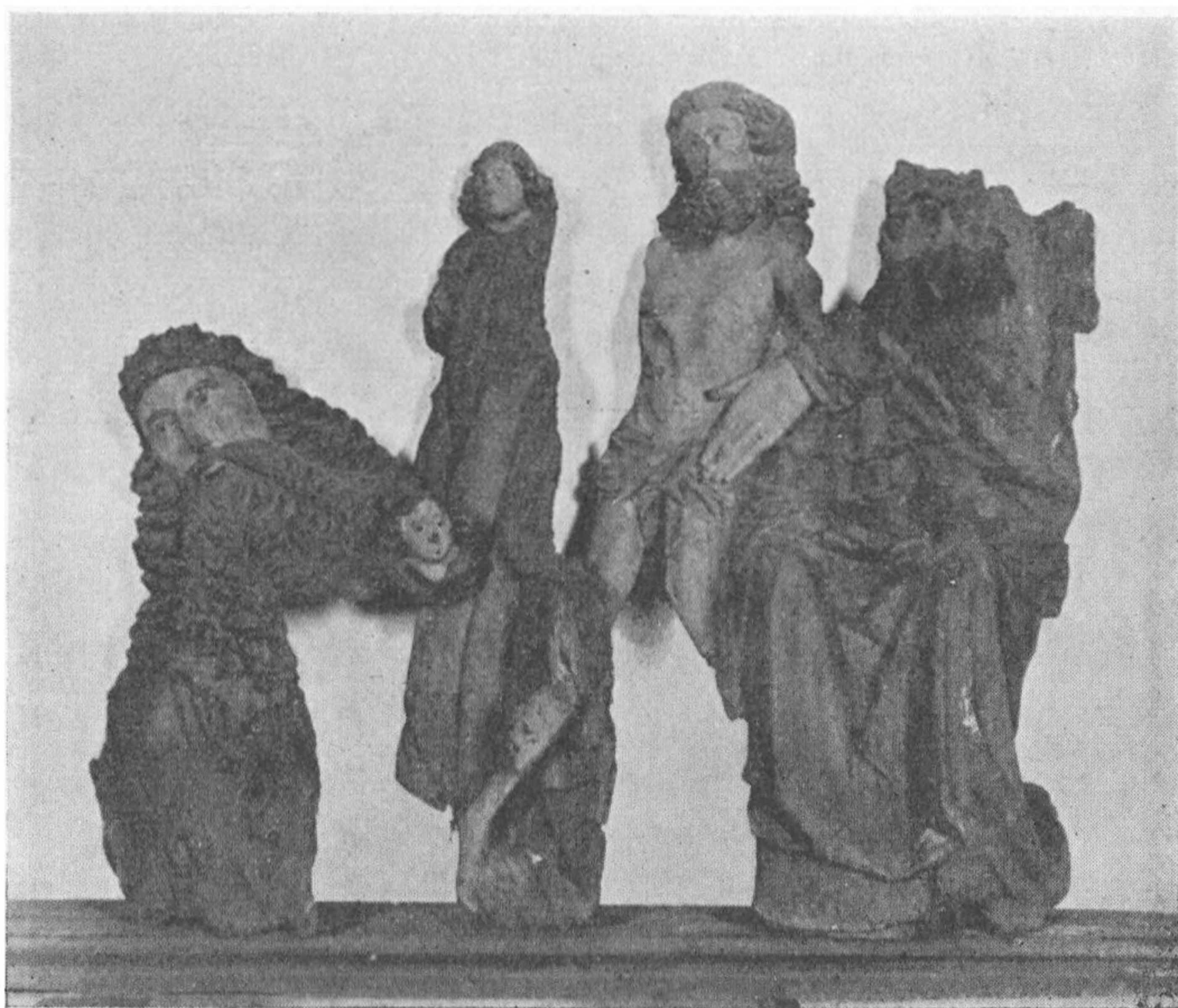
„Den gamle og den unge Gud“.

denne Tid gjort meget for Kirkens ydre og indre Udsmykning. Taarn og Vaabenhuis kom til, og indvendig prydedes Væggene med brogede Kalkmalerier. Løjnefaldende straks man træder ind, er et stort Krucifiks under Korbuen, og ved Siden af dette to mindre