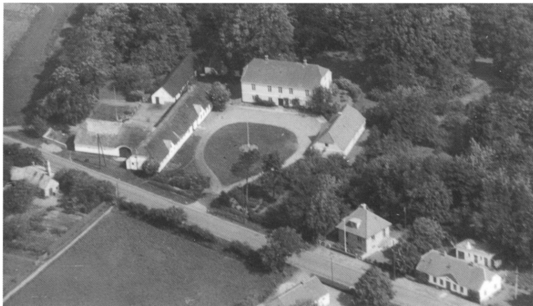
Luftfoto fra slutningen af 1930'erne.

når man kun kunne færdes over større afstande i hestetrukken vogn eller kane, levering af daglig stalddørsmælk til dagens mælkepris og til jul en halv hjemmeslagt gris til slagteripris. Desuden var forpagteren behjælpelig med at opstille borde og bænke m.v. til sommermøder i haven og vintermøder i præstegårdens store stuer. Mange af disse kontraktlige bestemmelser fik præstefamilien stor nytte og glæde af i de følgende år, ikke mindst under krigen, da brændsel og madvarer efterhånden blev strengt rationeret, og min fars kære Ford A, anskaffet i 1932, var klodset op. For mig, det yngste medlem af præstefamilien, blev den største gevinst ved forpagtergården og dens forpagterpar, at jeg dér fik et ekstra barndomshjem. Blev man sulten, kunne man aflægge