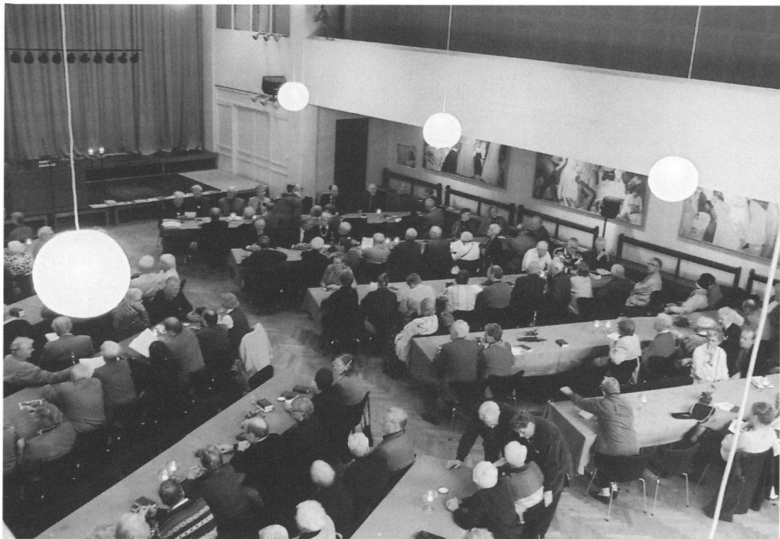
Over 170 mennesker mødte op til Historisk Samfunds 100-års jubilæums arrangement, der blev holdt i Festsalen på Askov Højskole - der hvor det hele begyndte.