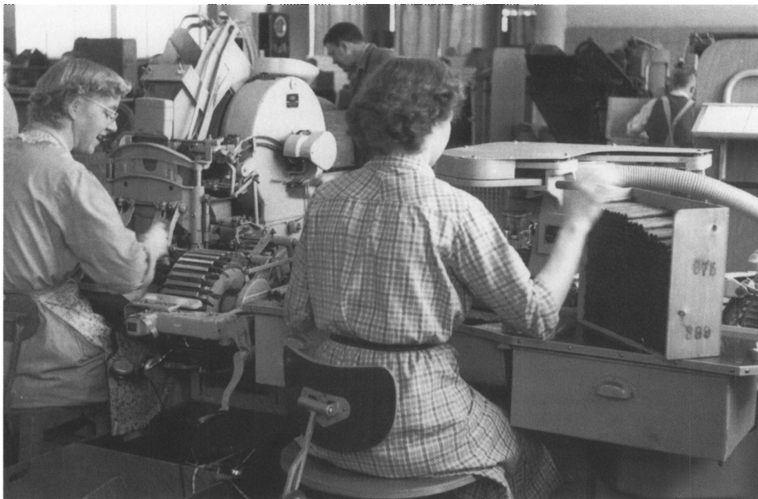
Kvinder i gang med maskinstripning.